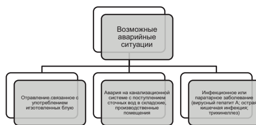
Рис. 3. Возможные аварийные ситуации

В последний раздел программы включают перечень возможных аварийных ситуаций, создающих угрозу санитарно-эпидемиологическому благополучию населения.