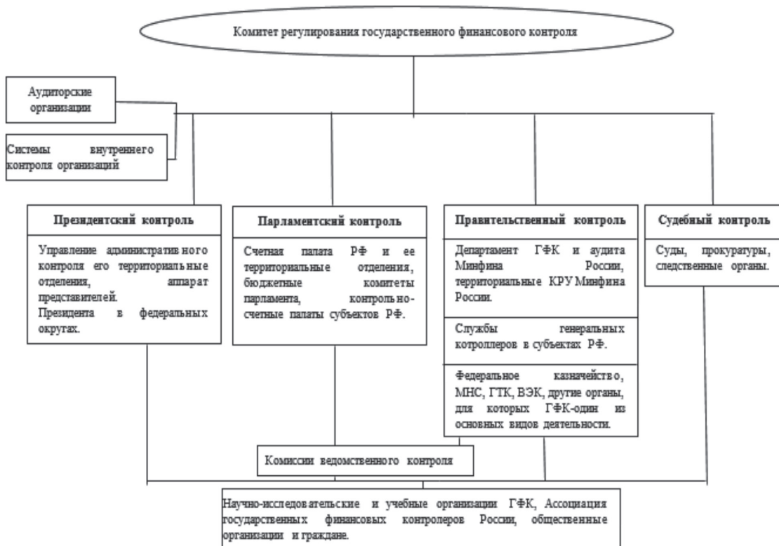
Рис. 2. Предполагаемая структура системы органов ГФК и ее взаимоотношений с органами негосударственного контроля (принципиальная схема)