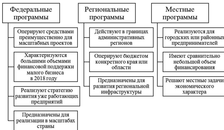
Рис. 3. Программы государственной финансовой поддержки предпринимательской деятельности 2018 г. [7]

Для обеспечения полноценной работы и развития малого предпринимательства на территории РФ в 2018 г. введены налоговые каникулы для субъектов малого предпринимательства. Первое время работы для бизнеса можно полагать самым трудным – расходы существенно превосходят доходы [10].