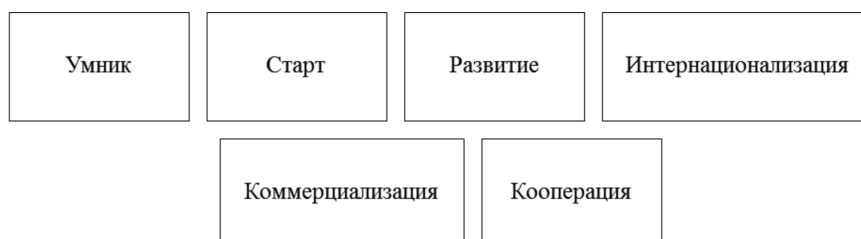
Рис. 4. Программы субсидирования федерального значения в РФ на 2018 г. [8]