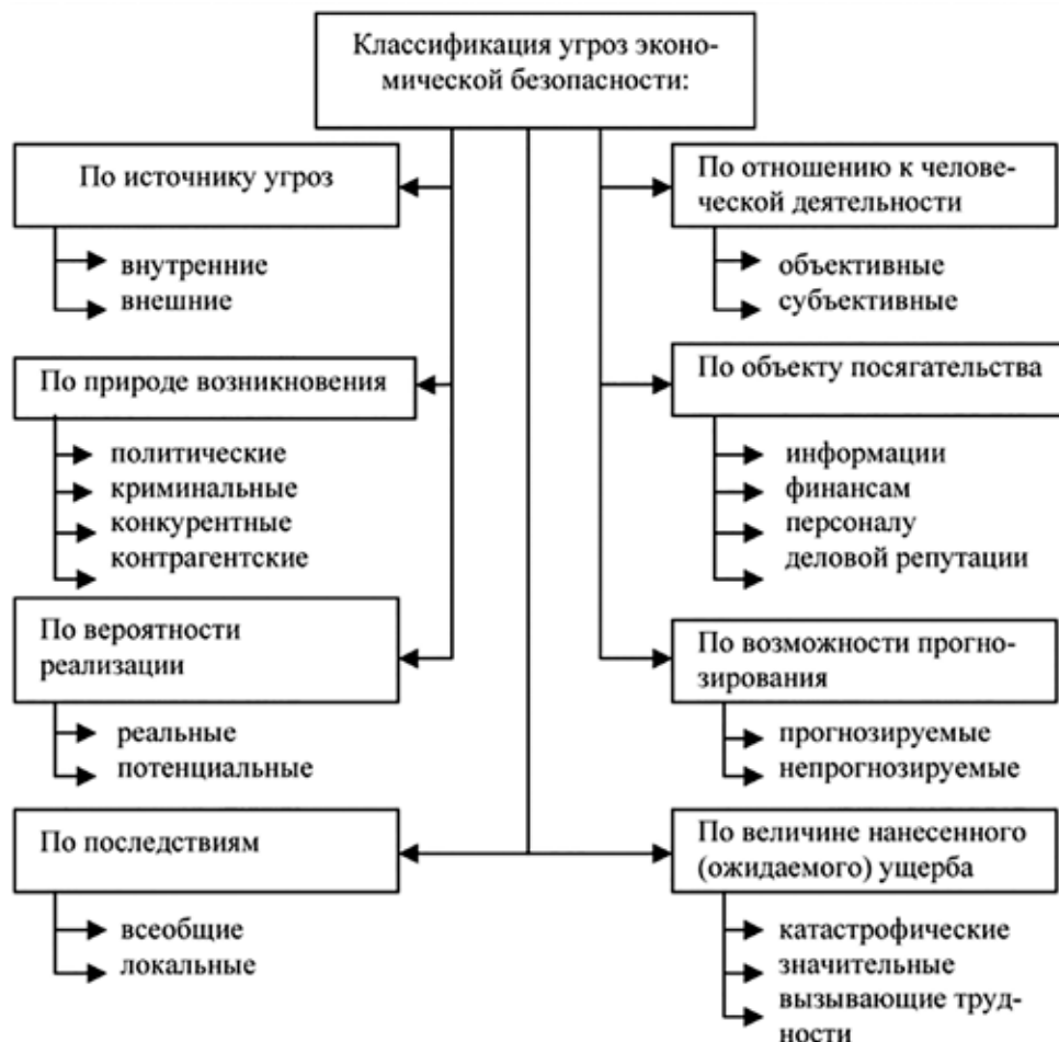
Рис. 2. Угрозы экономической безопасности предприятию [17]

Эффективная система управления возможно только при условии создания целостной системы управления вышеуказанными факторами. Так, например, управляя персоналом, важно изначально распределить между сотрудниками обязанности и уровень ответственности [16].