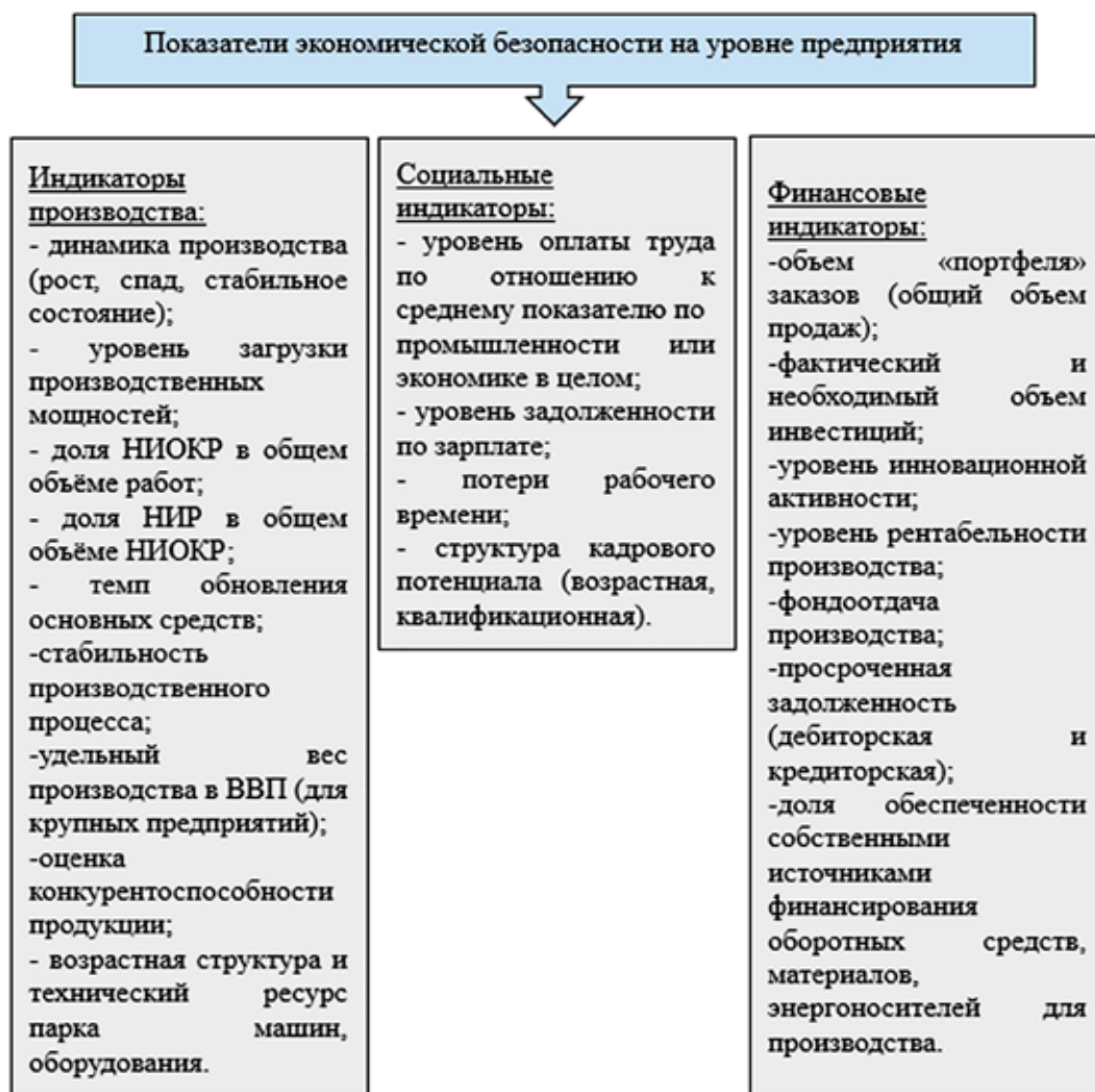
Рис. 3. Индикаторы экономической безопасности предприятия [18]

Каждое предприятие уникально, имеет свой набор особенностей вследствие большого спектра видов деятельности, что делает разработку унифицированного подхода системы показателей экономической безопасности предприятия трудновыполнимой задачей. На сегодняшний день существует множество мнений по поводу состава показателей и их пороговых значений, но нет единого подхода, и это обоснованно, ведь в промышленности требуется учет одних особенностей, а в торговле – других. Очевидно, что разработка должна быть отраслевой [19]. Отсутствие единого подхода к оценке безопасности на уровне предприятий затрудняет изучение вопросов данной тематики, но одновременно создает простор для научных воззрений. Тем не менее, разработка отраслевых индикаторов, а затем их обобщение должны стать первоочередной задачей, что позволит более эффективно