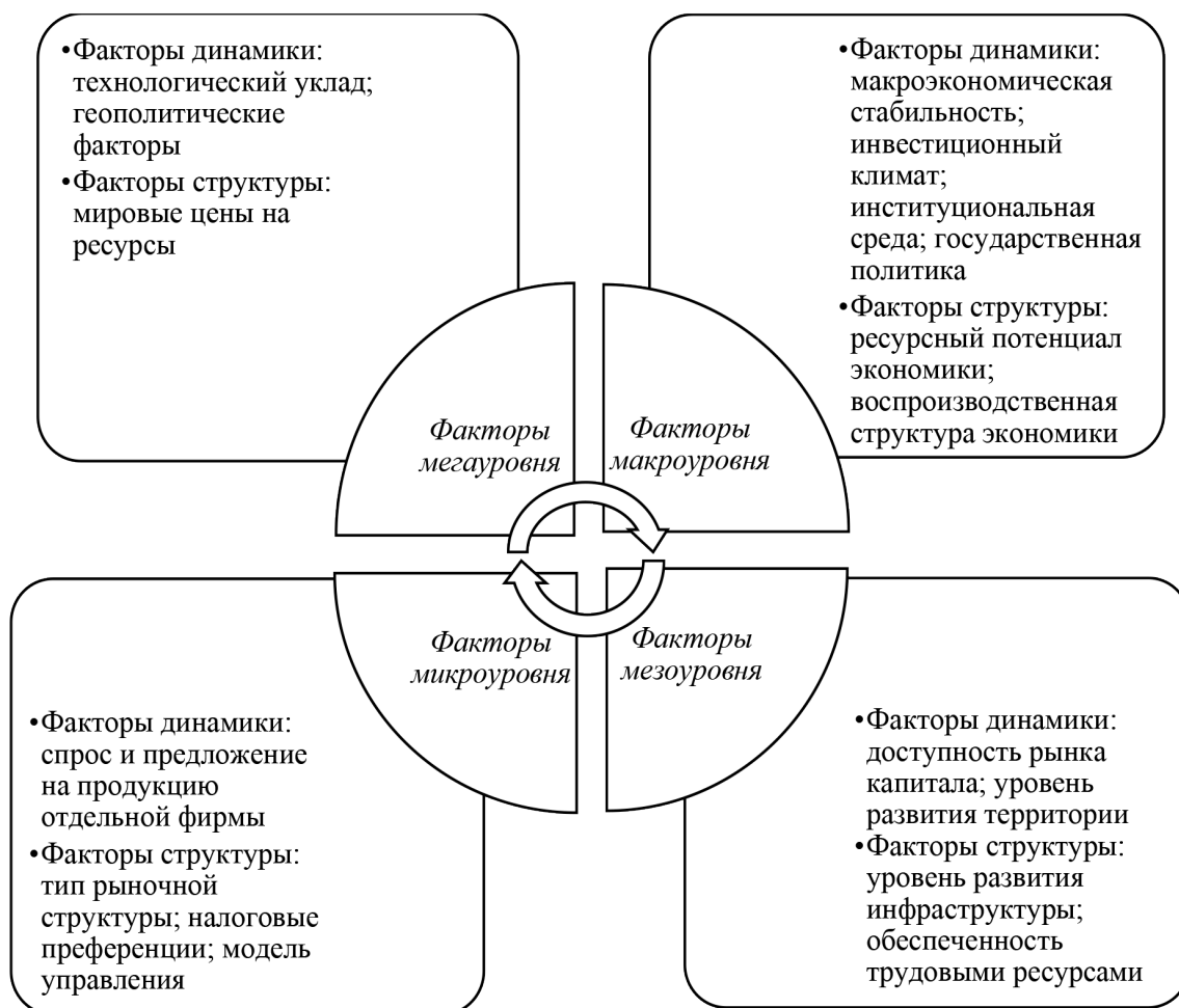
Рис. 1. Система факторов, определяющих ПИИ Примечание: составлен авторами на основе источников [11–13]

Обобщая теоретические трактовки ПИИ, можно систематизировать факторы, их определяющие. Сочетание уровня влияния факторов (мегауровня, макроуровня, мезоуровня и микроуровня) и характера воздействия факторов (факторы динамики и структуры) дает возможность матричной (комплексной) оценки влияющих факторов, что обуславливает стратегии осуществления ПИИ фирмами и модели государственной политики в отношении ПИИ. Комплексная система факторов ПИИ представлена на рис. 1.